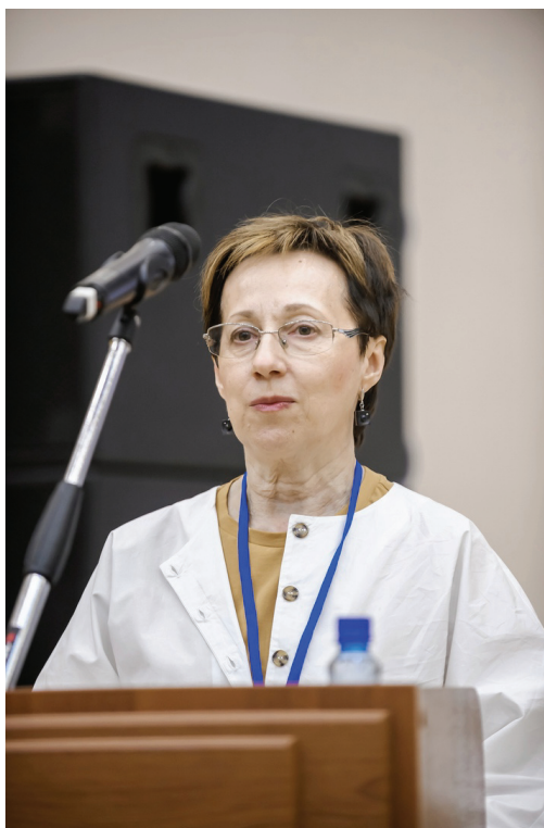
Выступление А.Э. Тенишевой