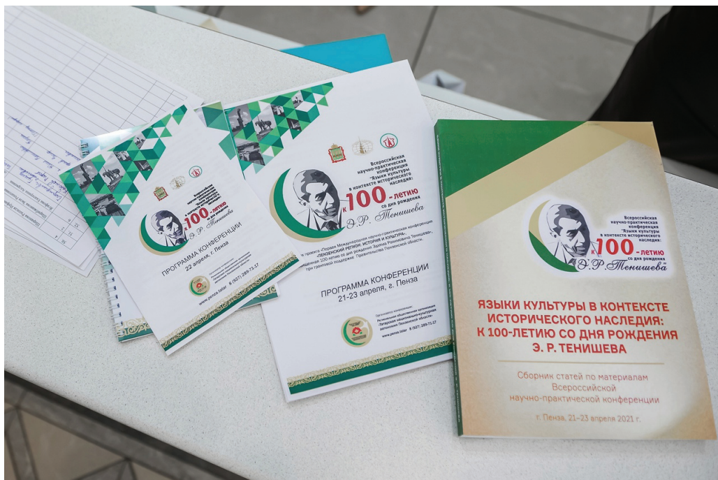
Печатная продукция конференции