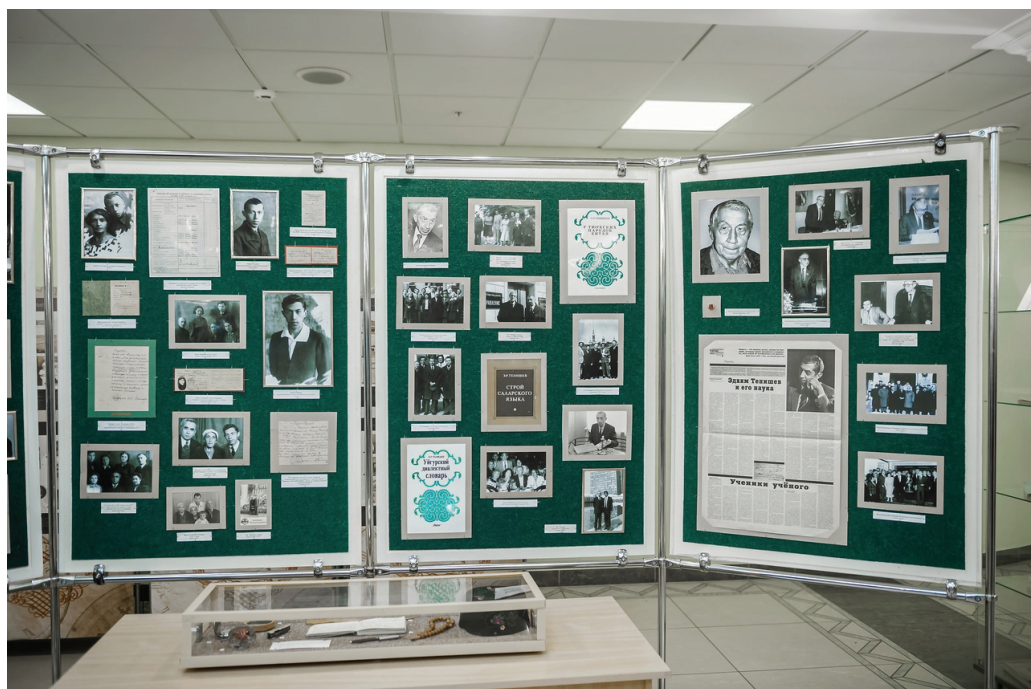
Фотоз экспозиция, посвященная Э.Р. Тенишеву