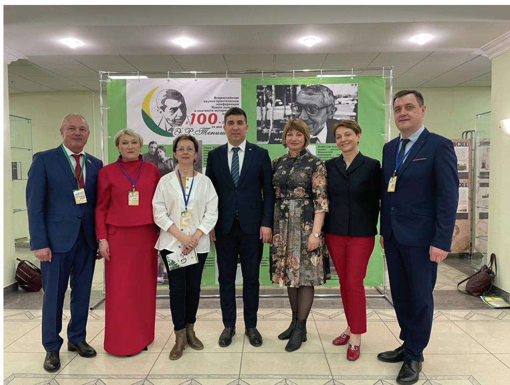
Участники конференции на фоне фотоз экспозиции