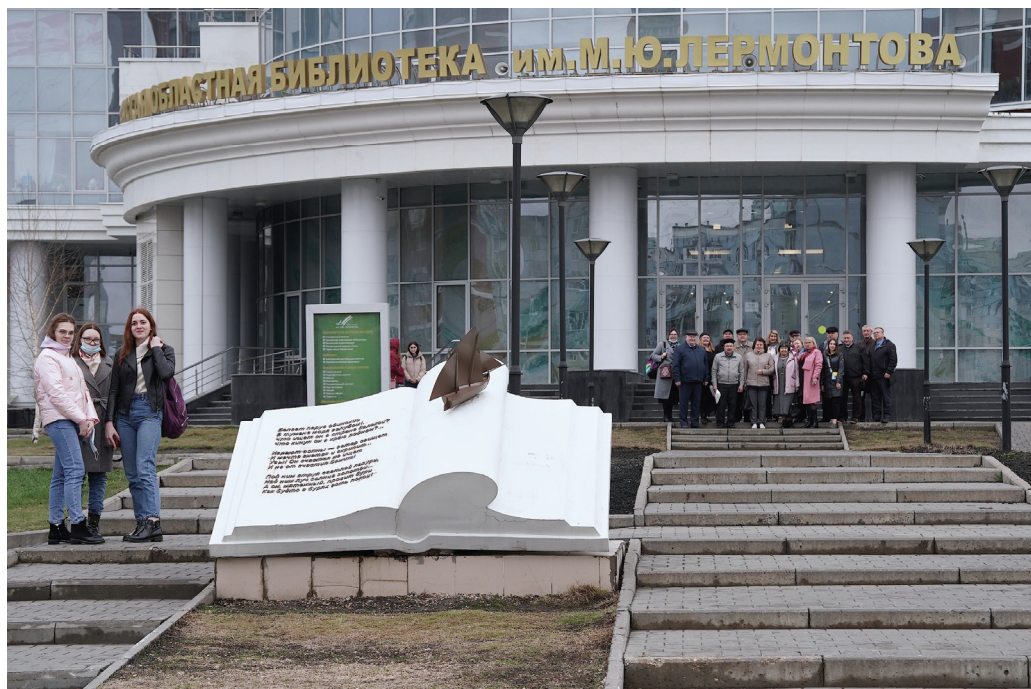
Участники конференции перед зданием библиотеки им. М.Ю.Лермонтова