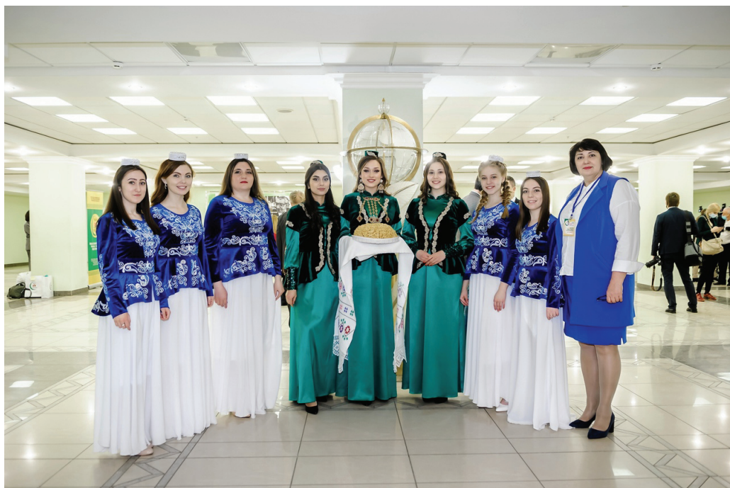
Гостеприимная встреча на Пензенской земле