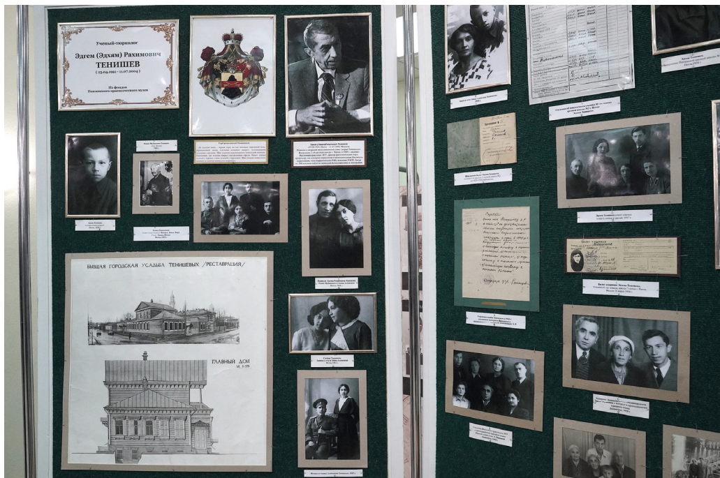
Фотоэкспозиция, посвященная Э.Р. Тенишеву