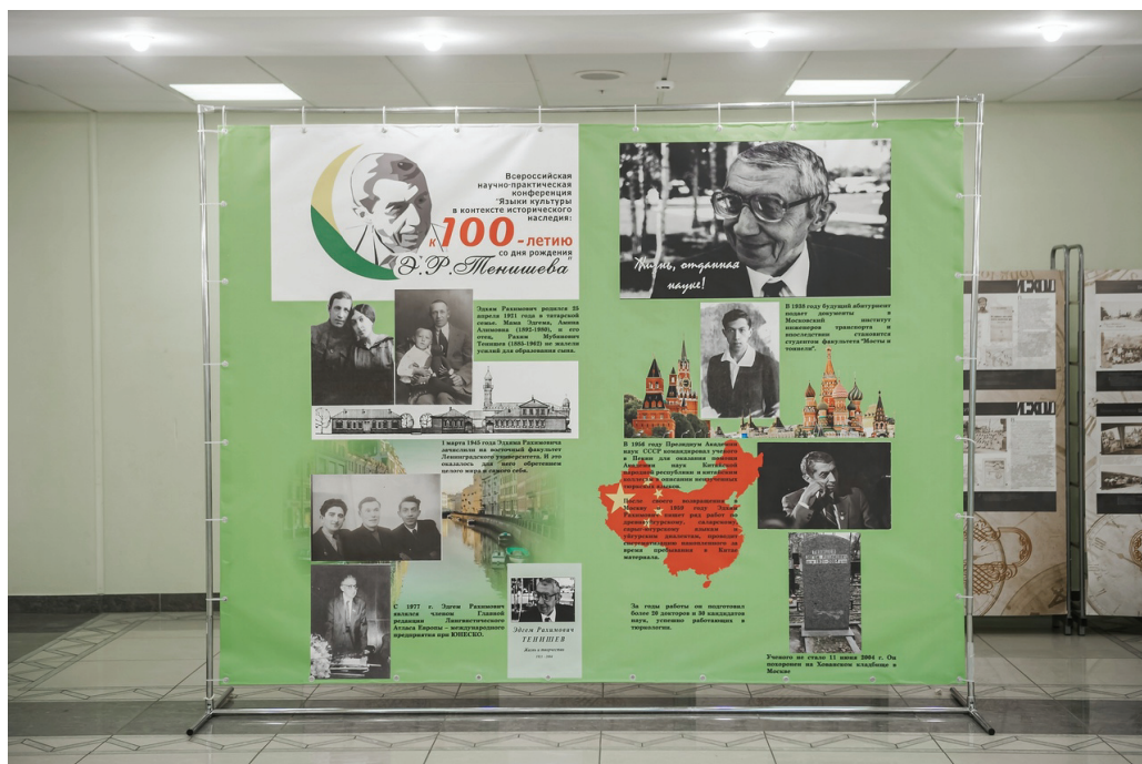
Тематическое оформление холла