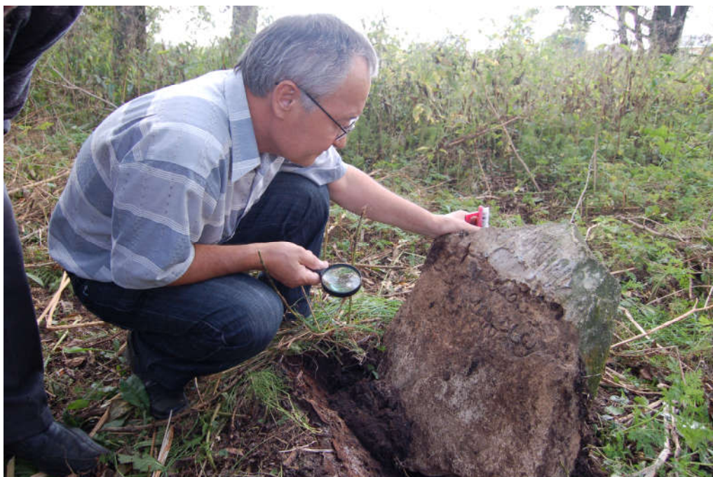
Во время полевых экспедиций

Минлегали Хусаинович является автором монографий «Историко-функциональные жанры башкирской литературы (генезис, типология, традиции)» [Надергулов 2002], «Стилевые особенности башкирских исторических сочинений XVI – начала XX вв.» [Нәзерғолов 2004], в которых освещаются особенности художественного стиля таких башкирских исторических жанров, как шежере, таварих и тарихнаме, а также одним из авторов коллективной работы «Письменные дастаны» [Язма 2006], где рассматриваются проблемы взаимосвязей традиций фольклорных эпосов с литературным началом.