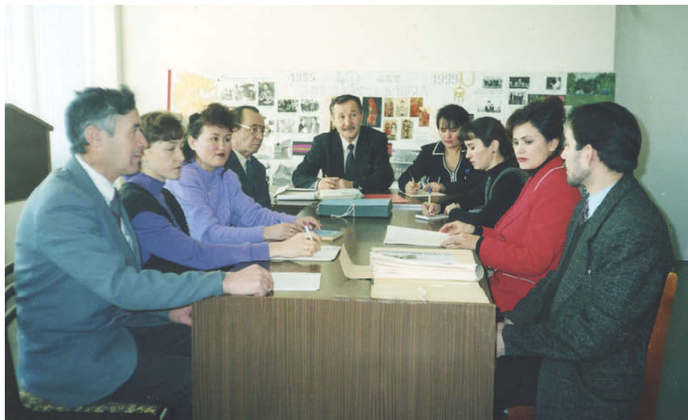
Сотрудники отдела литературоведения ИИЯЛ УФИЦ РАН