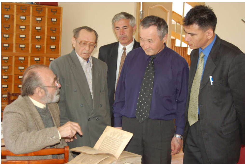
В кругу коллег.

Главными направлениями научных исследований Минлегали Хусаиновича являются литературоведение, археография, текстология, литературная критика. Сегодня он является автором более 350 научных трудов, в т. ч. 26 монографий, учебников для средних общеобразовательных школ и вузов, 22 статей в научных журналах, индексируемых в базах данных Web of Science, Scopus и в рецензируемых изданиях ВАК.